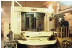
高精度大型マシニングセンター