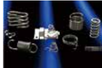
コイル・バネ製品