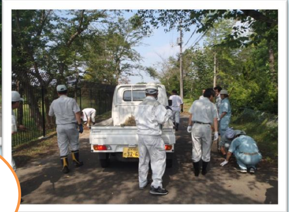
墓地参道の清掃作業