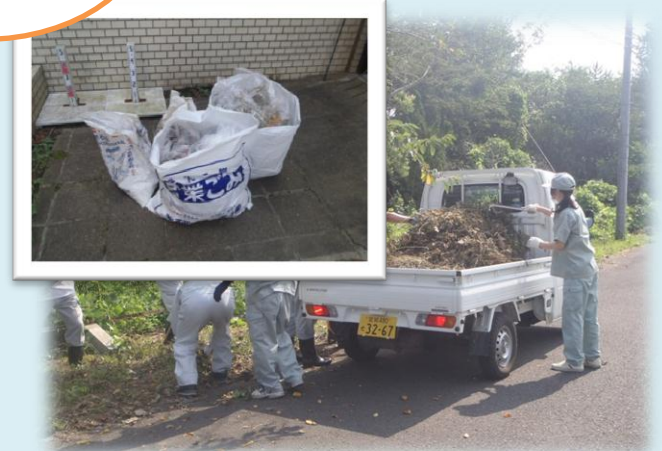
集めたゴミと刈草