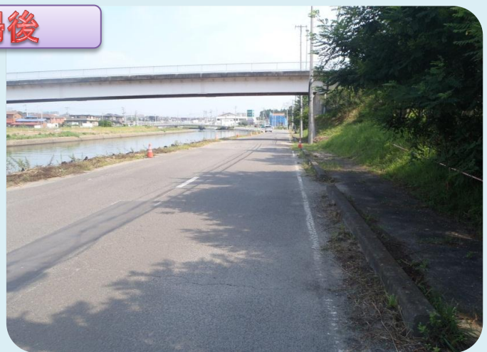
砂押貞山運河沿いの道路