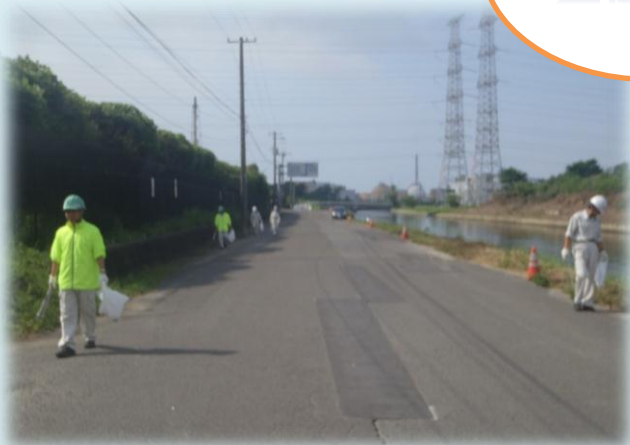
砂押貞山運河沿いのゴミ拾い