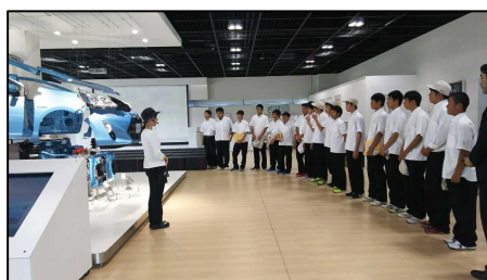
ものづくり企業見学