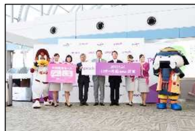
Peach Aviation の仙台空港 拠点化に伴う就航セレモニー