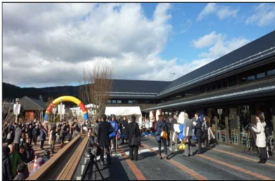
シーパルピア女川