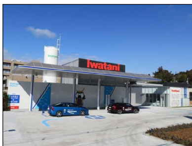
東北初の商用水素ステーション