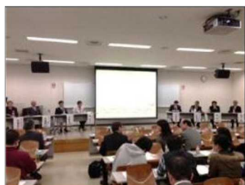
石巻地域包括支援シンポジウム