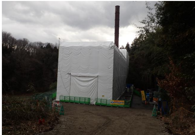
写真1 密閉養生(煙突は工程を分け除染・解体を実施)