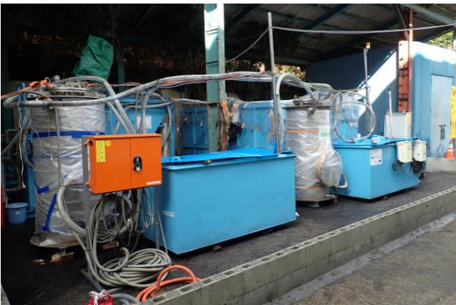
写真3 濁水処理施設