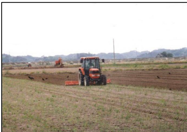
受益地内での営農状況