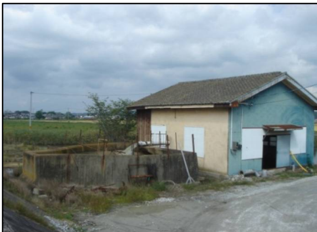
現在の排水機場(洲崎第一排水機場)は、基礎地盤の不同沈下に伴い建物が歪み、排水樋管や吐水槽に亀裂が生じている。