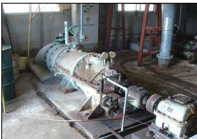
現在の横軸軸流ポンプ(口径600mm)