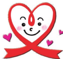
宮城県自死対策推進センター「ほっとちゃん」

宮城県保健福祉部精神保健推進室及び宮城県精神保健福祉センターが中心となり運営することとし、保健所等関係機関と綿密に連携しながら、県内市町村における自死対策の推進を支援します。