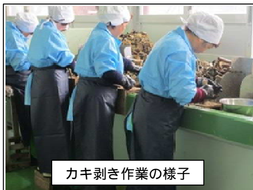
カキ剥き作業の様子

カキのシーズンが到来しました。カキの酢の物やカキ鍋などで宮城の美味しいカキをご賞味下さい。