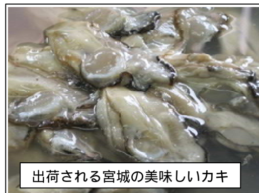
出荷される宮城の美味しいカキ