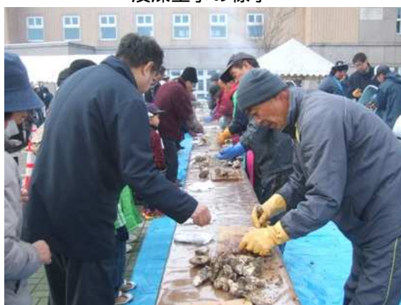
焼きガキコーナー

カキだけでなく, シーズンの乾ノリや焼きノリ, はらこ飯等の販売もあり, 寒いこともあってカキ汁やノリ汁, 無料の焼きガキコーナー等の暖かい食べ物に人が集まりました。