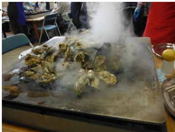
湯気上げる殻付きカキ