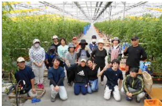
株式会社みちさきのみなさん