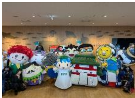
【観光キャラバン】キャラクター・伊達武将隊集合

さらに、10月12日には、JR東日本主催のイベント「鉄道の日～お客様感謝DAY in SENDAI～」に参加し、駅東西自由通路に自治体PRブースを設け、パンフレット配布やシールアンケートを実施しました。スタンドグラス前のメインステージでは「むすび丸」「岩沼係長」「アサヒナサブロー」のキャラクターたちによる観光クイズ大会を行い、会場を盛り上げました。