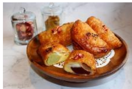
さつまいも・いちごのパイ