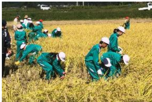
真剣に刈り取ります