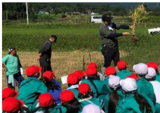
稲の刈り方を教わります

農業農村整備部では、農業農村の有する多面的機能への理解を深めてもらうため、今後も地域活動の支援を行っていきます。