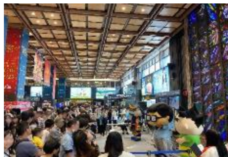
【鉄道の日】メインステージ