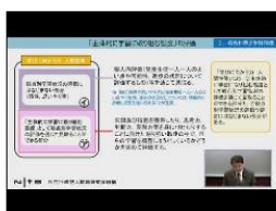
新学習指導要領に対応した学習評価 (小・中学校編) : 新学習指導要領編 No33

1コマの授業で3観点すべてを評価するのではなく、「記録に残す評価」の場面を精選することが大切です。