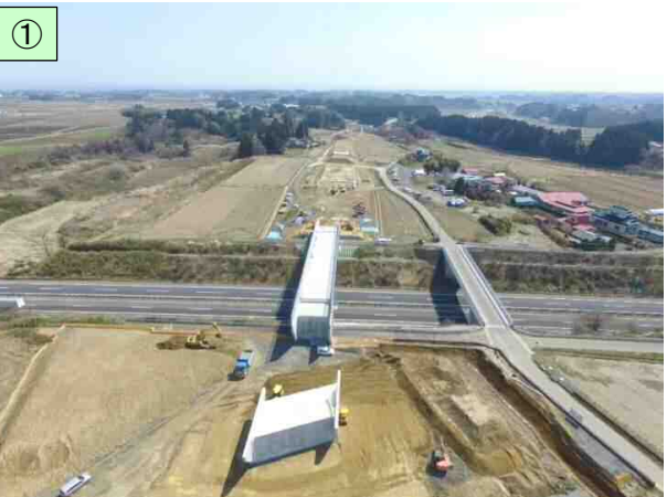
Ⅳ期区間の整備状況(平成30年4月)