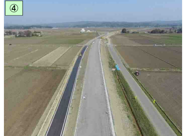
Ⅱ期区間の整備状況(平成30年4月)