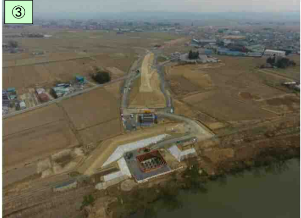
Ⅲ期区間の整備状況(平成30年4月)