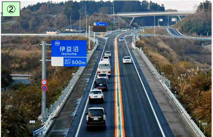
平成23年11月に供用を開始したⅠ期区間