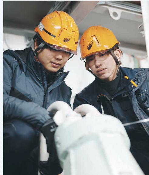
▽みらい造船を引っ張る存在になることを2人とも目標に掲げる