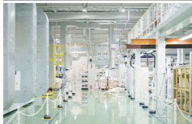
上：2021年2月に竣工した多賀城工場。LIMEXの5文字が 燦然と輝く 下：工場内は掃除や整理が隅々まで行き届いている