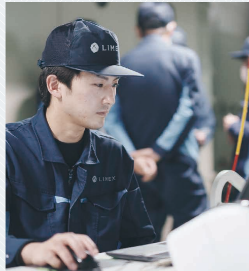
▽事務仕事もミスがないよう、確認作業に怠りはない

資源循環を前面に出す経営方針に感銘を受けた 地球環境に貢献できる企業で 役割の一部を自分も担いたい