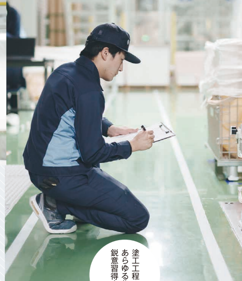
塗工程の あらゆる作業を 鋭意待機中！