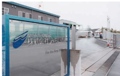
上：みらい造船が立ち上がり、工場も集約。2019年9月に新工場が完成し、敷地面積はなんと約4万平方メートル 下：みらい造船の工場では現在、協力会社の社員も含めて、約300人が働く