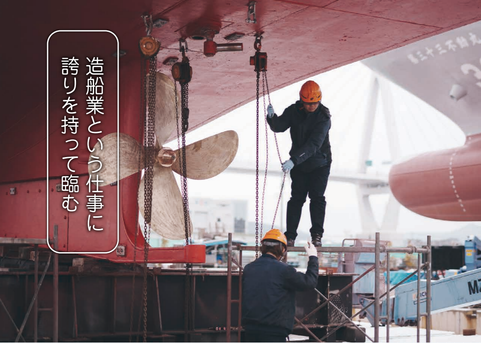
息の合った連携で手を動かしていく2人 みらい造船にとって欠かせない人材であろうと日々努力を重ねる