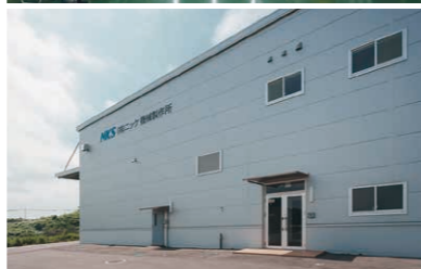
上：工場は50メートルにわたる装置まで一体的に対応できる。いずれの機器も数メートル単位のユニットごとに製造する 下：東北地方のお客様の近くで製造作業を行うこと、さらには会社設立40周年を機にさらなる発展を目指し、東北事業所は開設された