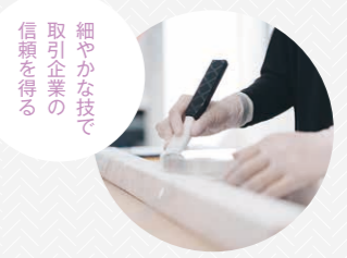
細やかな技術で 取引企業の 信頼を得る