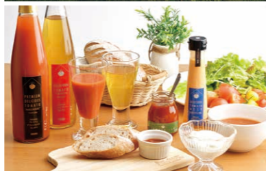
上：デリシャスファームは約7000坪という広大な土地で デリシャストマトを中心に野菜を栽培している 下：加工品もデリシャストマトを広く知らしめる役割を 担っている