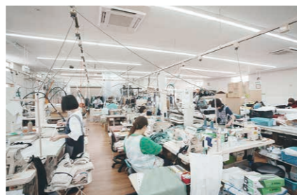
社屋内には所狭しとミシンが並び、従業員は黙々と作業に打ち込んでいる

スタ・ディアの社名には愛される、信頼される(ディア)ことの始まり(スタート)という 意味が込められているが、もともとは“仕立て屋”を宮城弁で言ったとき“スタ・ディア”と 聞こえることから付けられた。創業21年を迎えた企業であり、その技術力の高さは折り紙付き。 高級婦人服の製造で高い信頼を勝ち得ている。東日本大震災で社屋が大きな被害を受けたこと から、本拠を内陸部に移した。品質維持のためには従業員が大事、と働きやすい環境づくりに 力を注いでいる。日々の業務では、社員各々が改善提案や意見を出し合い、高品質な洋服づくりに 励む。主な取引先には ANAYI や allureville で知られる株式会社ファーストカンパニー、 ファッションネット株式会社などが名を連ねる。