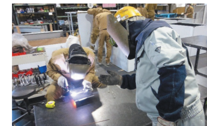
企業での実技指導の様子(電気溶接)