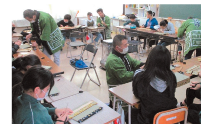
小学校での体験教室の様子(量製作:ミニ量づくり)