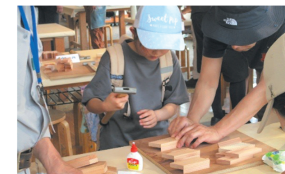
公共施設等での体験教室の様子(建具製作:木工パズルづくり)

指導対象者は、基本的には小中学校等の児童・生徒(工業高校等の学生を除く)及びその保護者等とするが、参加者の年齢が幅広い場合は、年齢層に応じて実演・体験内容を用意