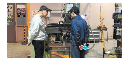
工業高校での実技指導の様子(機械加工(フライス盤))