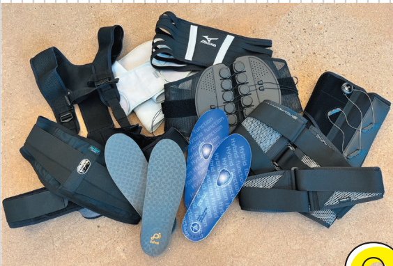
腰や足の負担を軽減するための対策グッズ。

成功報酬型のクリエイティブビジネス「DMARKプロジェクト」に参画しています。東北を拠点に活動するクリエイターがクライアントと協力し、商品開発やブランディング、マーケティングを行うクリエイティブパートナーシッププロジェクトです。