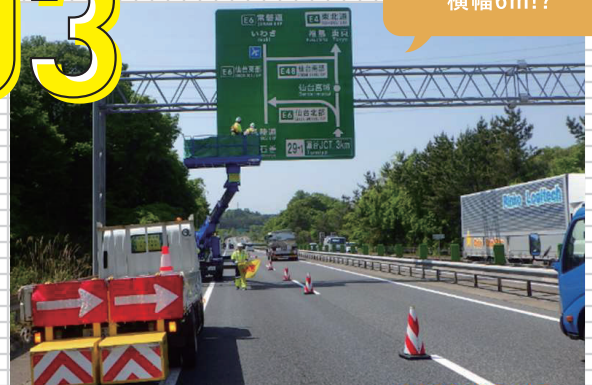
高速道路上の標識点検も大切な仕事の一つ。