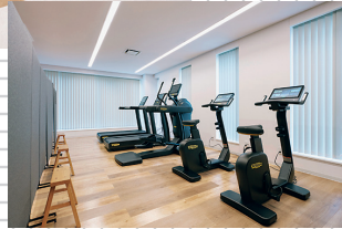
働きやすさに特化した 新拠点が完成!