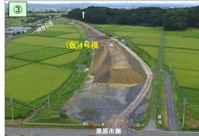
III期区間の施工状況((仮)4号橋付近)