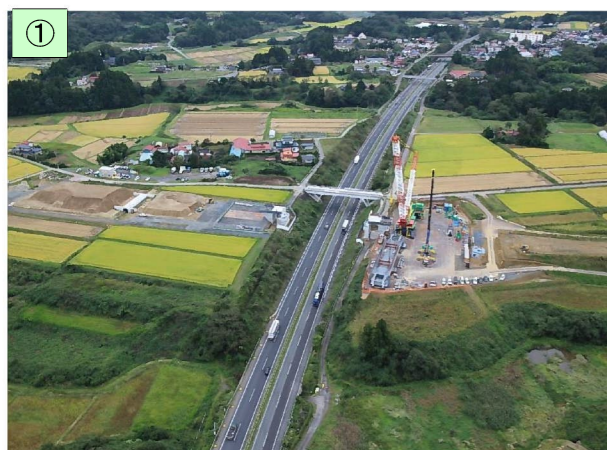
IV期区間の施工状況(後沢本線橋)