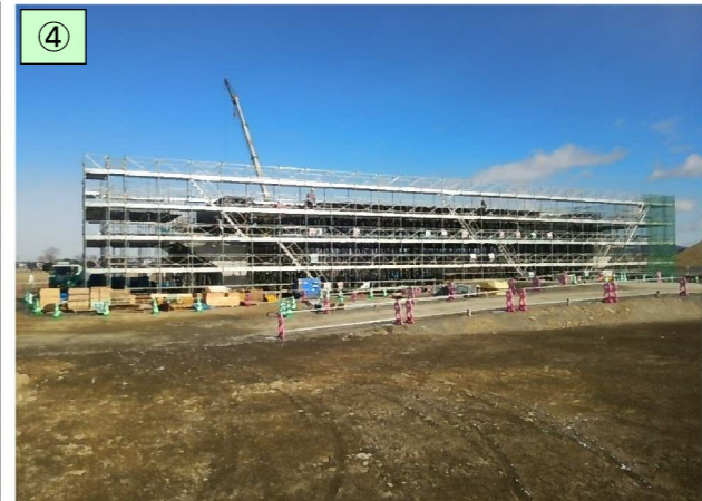
II期区間の施工状況((仮)中田IC橋施工状況)