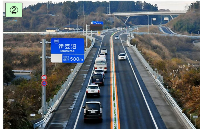
平成23年11月に供用を開始した I 期区間