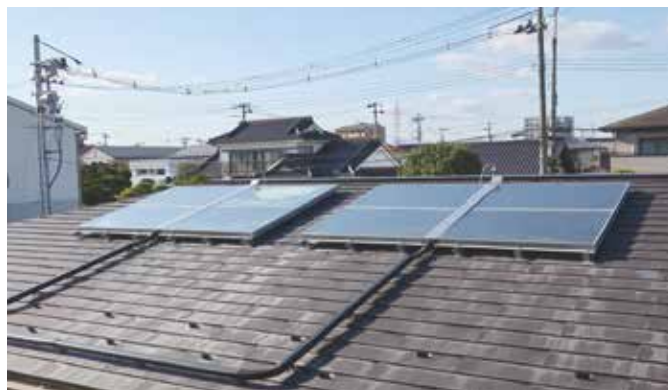
施設屋上に設置されている太陽熱集熱器

コスモス中野栄では、デイサービスやショートステイサービスを提供しているため、お風呂等の給湯設備が多くなっています。「太陽」というと太陽光発電を思い浮かべる方も多かもしれませんが、「太陽」のエネルギーを電気ではなく熱として利用することで、給湯設備を効率的に利用するとともに、災害時でも継続した施設利用の実現に役立っています。