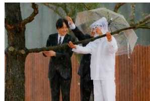
第47回全国育樹祭 お手入れ行事（福井県）