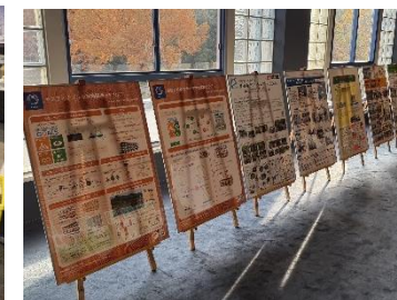
パネル展示ブース