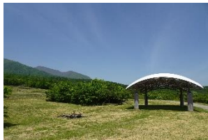
南蔵王野営場（白石市）

【内容】：平成9年開催の第48回全国植樹祭で天皇后陛下（現在のの上皇太后陛下）がお手植えされた樹木に対する皇族殿下によるお手入れ