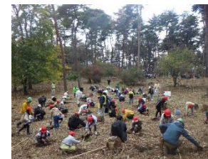
植樹作業 大衡小学校