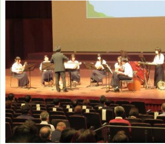
オープニング演奏 白石高等学校マンドリン部