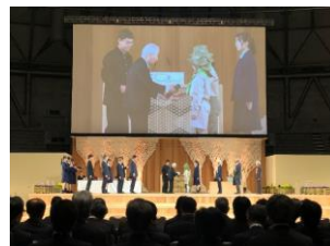
第47回全国育樹祭 式典行事（福井県）