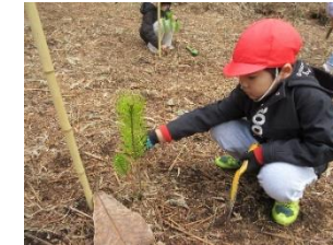
植樹作業 大衡小学校