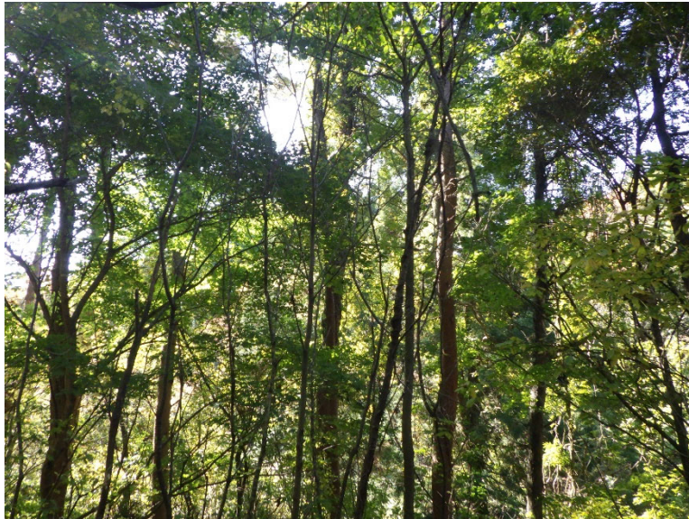
薬剤散布が難しい区域について広葉樹林化が進行