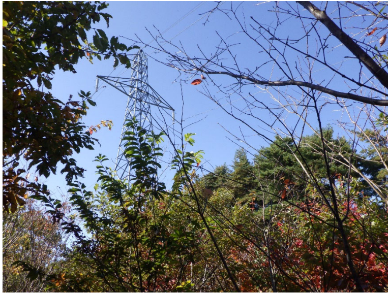
高圧線付近の散布作業は技術的に困難