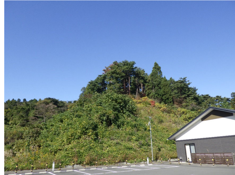
施設の隣接区域についても同様