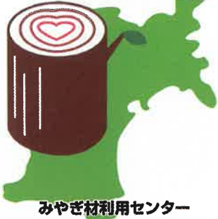
みやぎ材利用センター

みやぎ材利用センターが品質を検査し、合格した木製品には、安心・安全の証として「優良みやぎ材認証シール」が貼付されます。また、原木生産地名や製材・加工社名などを証明するため、「優良みやぎ材認証書」も交付されます。