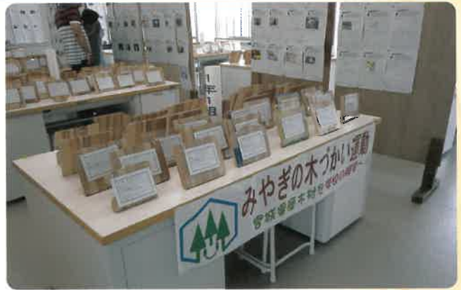
宮城県産材を活用した木製品（株式会社ケアサービス希慈（石巻市））