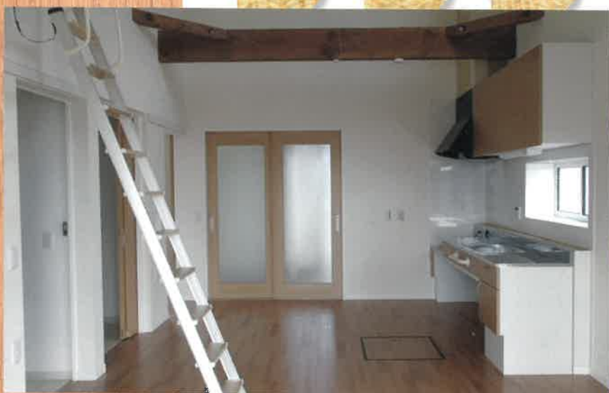
宮城県産材を使用して建設された災害公営住宅（山元町新山下駅周辺地区(第1期)）