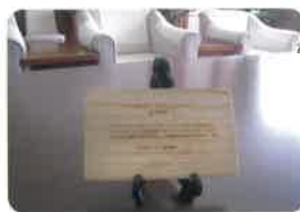
東日本大震災で被災した県内の木材を加工した合板が宮城県庁の知事応接室のテーブルに使用されています。