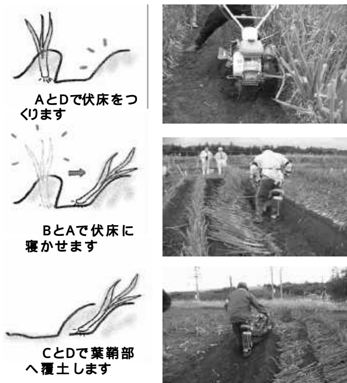
図2 開発機による作業の様子