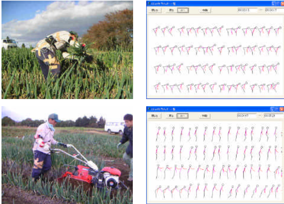
図3 慣行手作業(上)および開発機による作業(下)中の姿勢