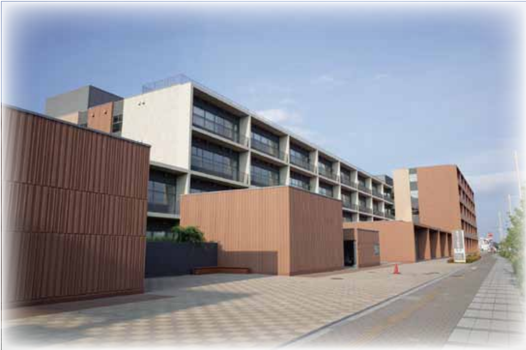
～まなウエルみやぎ全景～