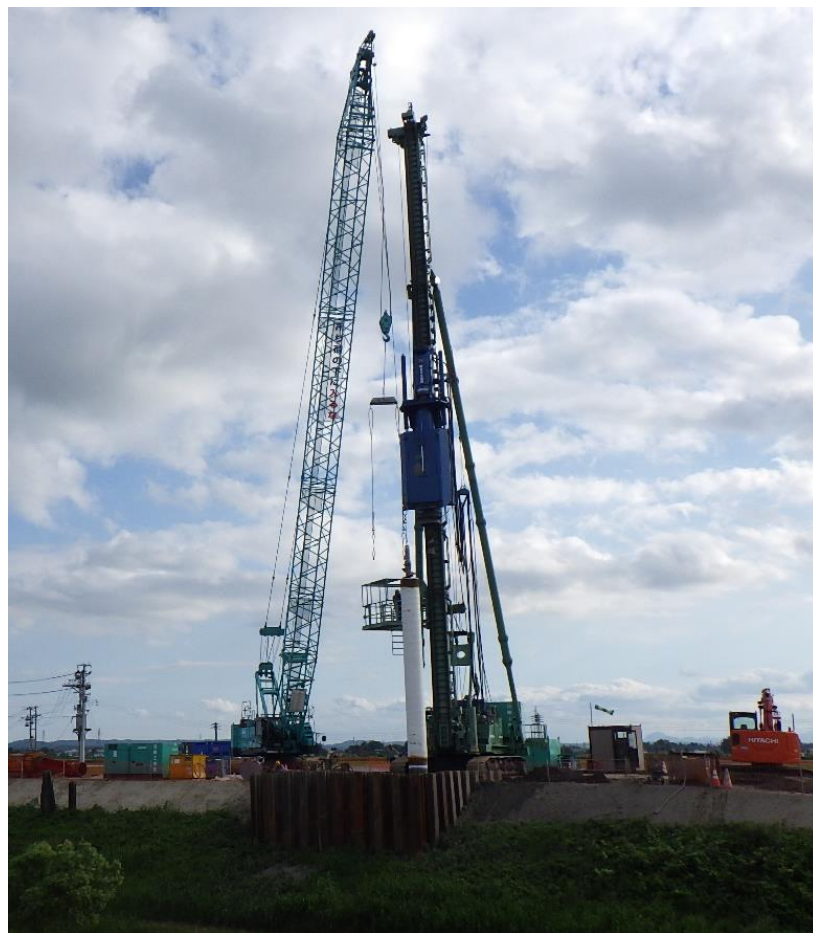
基礎杭施工の状況