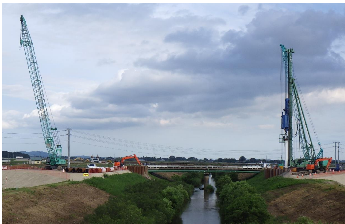
橋梁下部工の施工状況