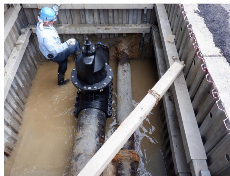
ストッパー弁設置状況