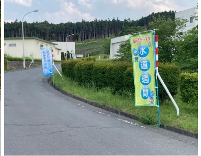
麓山浄水場における懸垂幕・のぼり旗の設置状況(5月24日～6月9日)