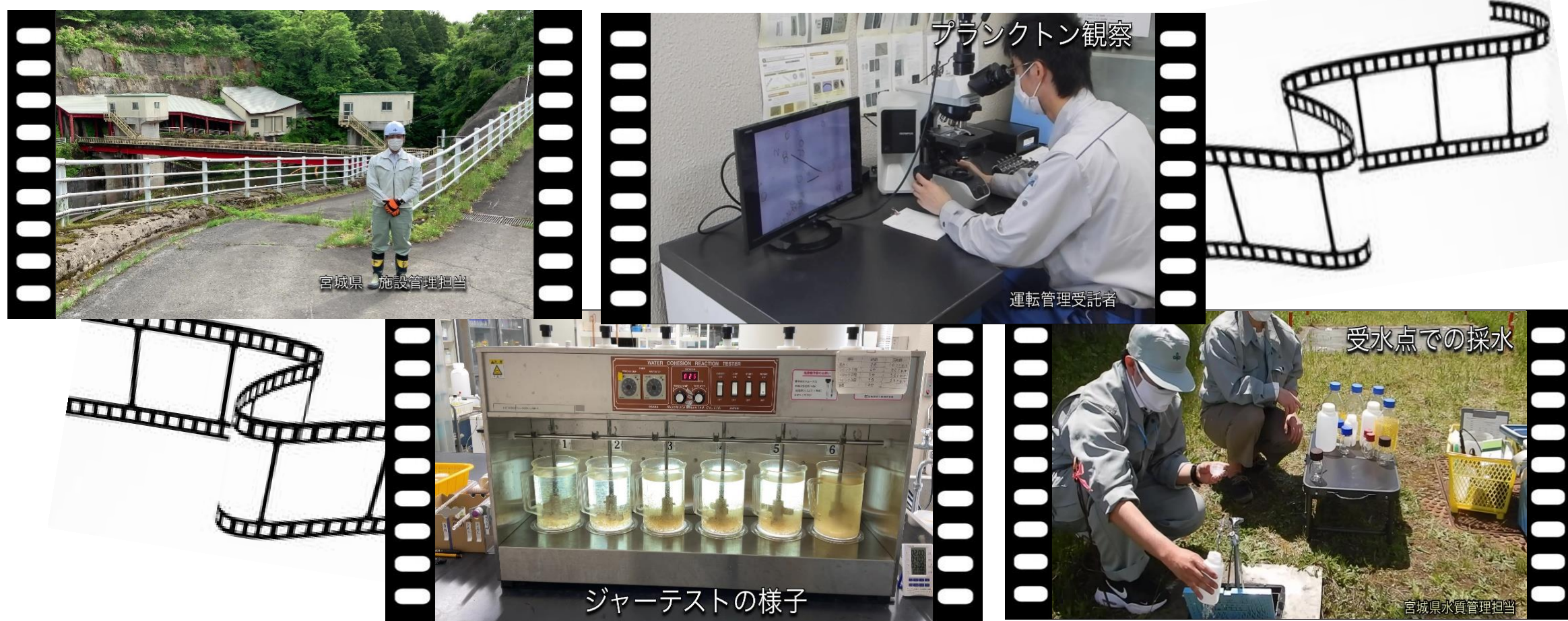
「浄水場のしごと」PR動画より抜粋

新型コロナウイルス感染拡大防止対策のため、現在浄水場の施設見学や出前講座等の受付は中止しておりますが、施設見学等に代わる新たな広報ツールとして動画を制作し、ホームページに掲載しました。今回は、水質管理をテーマに制作しています。学校等の教材や地域学習等に広くご活用いただけると幸いです。