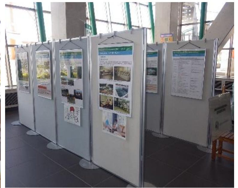
大崎合同庁舎「大崎広水・仙台北部工業用水 通水40年の歩み」パネル展(5月31日～6月10日)