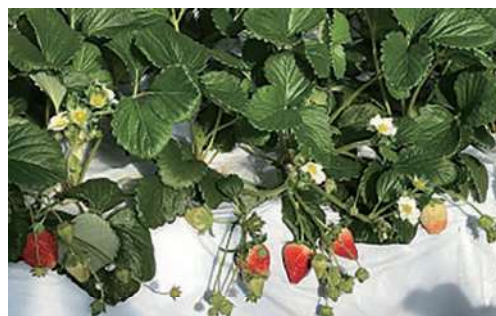
白マルチで採光を改善

普及センターでは、JAみやぎ仙南蔵王地区いちご部会と連携して、植物の光合成を促進するための炭酸ガス施用や温湿度管理の改善などの収量向上や省力化につながる技術の導入を支援しました。その結果、部会において生産額が向上し、活気がでてくるなどの効果があったことから、今後は、管内全体の施設園芸に、この取組の普及を図っていきます。