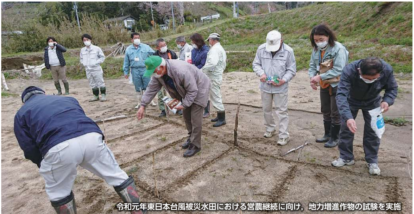
令和元年東日本台風被災水田における営農継続に向け、地力増進作物の試験を実施

HP https://www.pref.miyagi.jp/soshiki/ok-nokai/