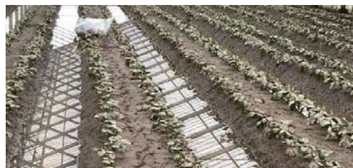
冠水して泥をかぶったいちご

普及センターでは、被災した作物の早期営農再開と被災前の収量品質確保を目的に技術支援していきます。