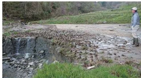
法面が崩落した水田

普及センターでは、復旧工事終了までの所得確保、地域農業についての話し合い、経営体の経営改善に向けた取り組み支援を通して、担い手が意欲を持って営農再開することができるよう活動していきます。