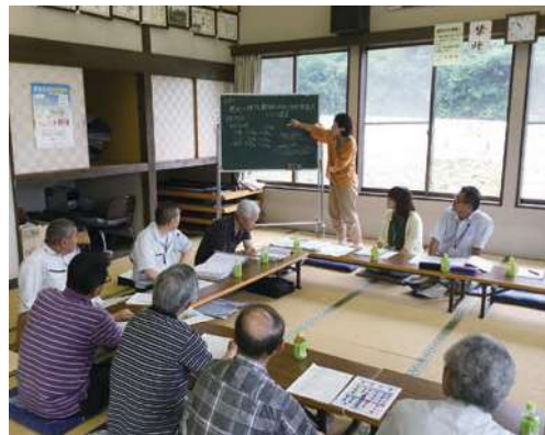
法人化に向けた勉強会

普及センターでは、地区で転作作物として取り組んできたそばの収量の安定化と新規園芸品目への取り組み支援に加え、水田農業の将来を担う集落営農法人設立に向けた基礎的知識の習得や事業計画作成を支援し、ほ場整備を契機とした集落営農がスムーズに発進できるよう支援していきます。