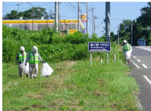
村田地区清掃状況