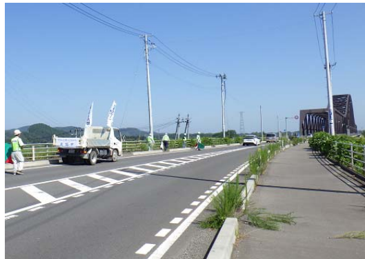
丸森地区清掃状況