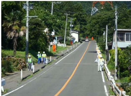
白石地区清掃状況