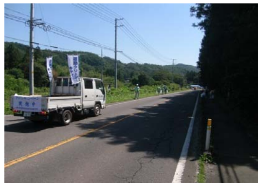
蔵王地区清掃状況