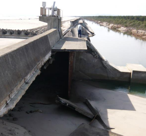
被災後（平成23年3月24日）