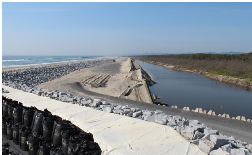
仮復旧後の状況（平成24年6月2日）