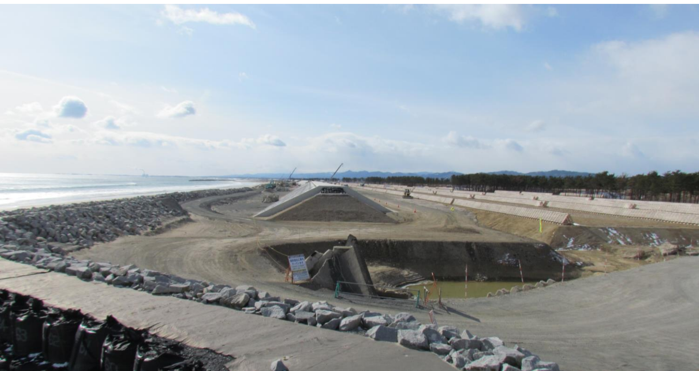
本復旧工事の状況（平成26年2月）

震災による津波で、宮城県内の農地を守る海岸堤防のうち、26.5kmが壊れました。農林水産省東北農政局と宮城県農林水産部では、本格的な復旧の前に大型土のう設置や応急仮堤防設置などを行いました。平成24年度からは、本復旧工事に着手しています。