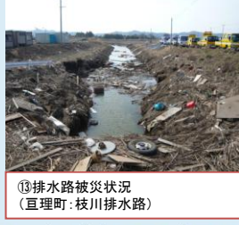
⑬排水路被災状況 (亶理町: 枝川排水路)