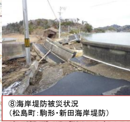
⑧海岸堤防被災状況 (松島町: 駒形・新田海岸堤防)