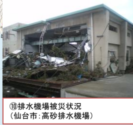
⑩排水機場被災状況 (仙台市: 高砂排水機場)