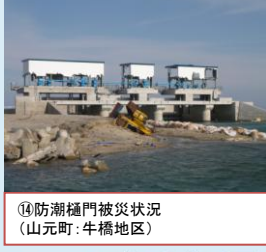
⑭防潮樋門被災状況 (山元町: 牛橋地区)