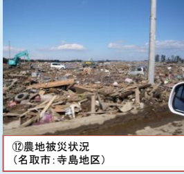
⑫農地被災状況 (名取市: 寺島地区)