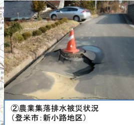
②農業集落排水被災状況 (登米市: 新小路地区)