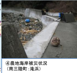
④農地海岸被災状況 (南三陸町: 滝浜)