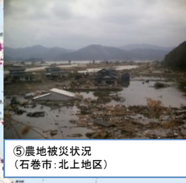
⑤農地被災状況 (石巻市: 北上地区)