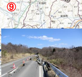
⑨農道被災状況 (川崎町: 蔵王町: 仙南地区)