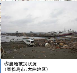
⑥農地被災状況 (東松島市: 大曲地区)