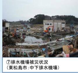
⑦排水機場被災状況 (東松島市: 中下排水機場)