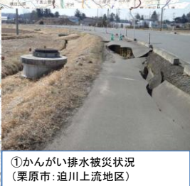
①かんがい排水被災状況 (栗原市: 迫川上流地区)