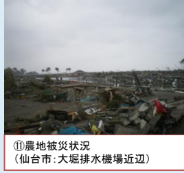
⑪農地被災状況 (仙台市: 大堀排水機場近辺)