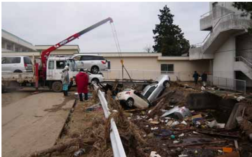
ガレキ撤去作業(平成23年3月21日)