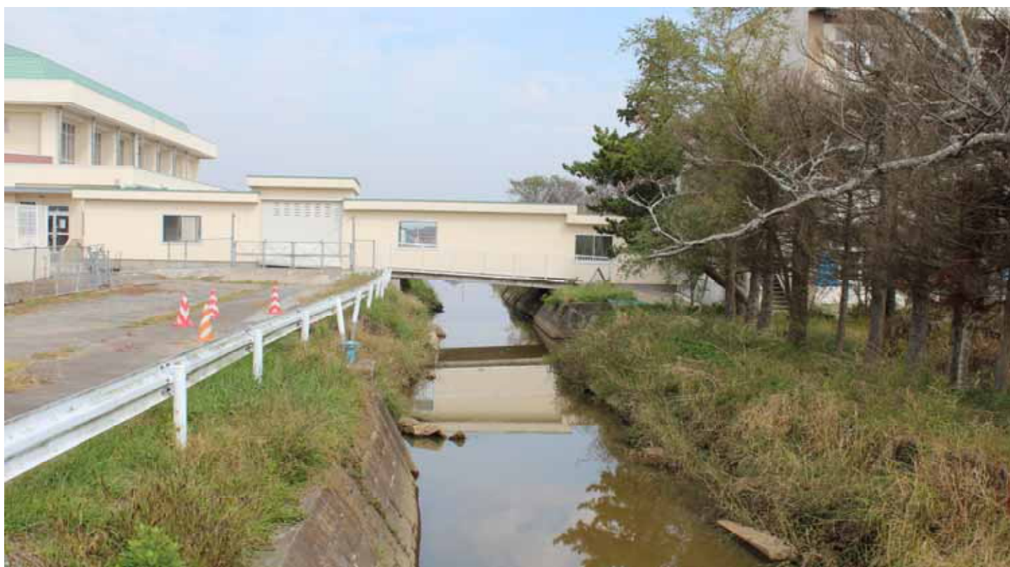
ガレキ撤去後(平成23年10月10日)

震災による津波で被災した農業用幹線排水路について、緊急応急工事として、名取市外6市町において、東北農政局が延長27.02 km(26路線)、県農林水産部が延長80.5km(57路線)のガレキ撤去を行い、平成23年8月末に作業を完了しました。