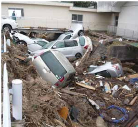
被災直後(平成23年3月21日)