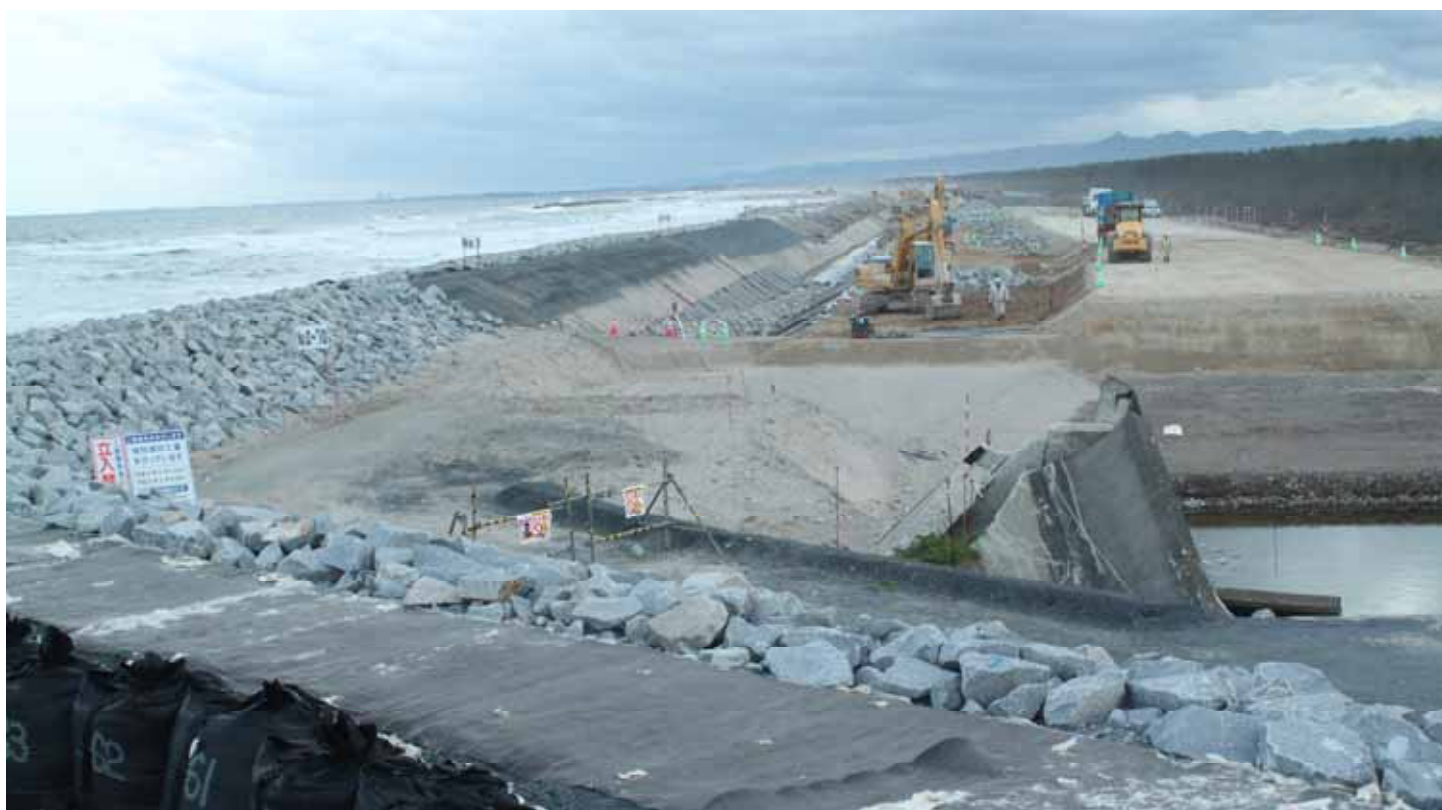
現在の状況(本復旧工事中)(平成24年10月10日)

震災による津波で、宮城県内の農地を守る海岸堤防のうち、26.5kmが壊れました。農林水産省東北農政局と宮城県農林水産部では、本格的な復旧の前に大型土のう設置や応急仮堤防設置などを行いました。平成24年度からは、本復旧工事に着手しています。