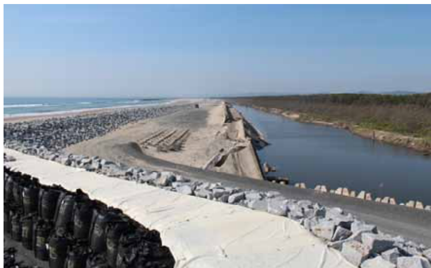
現在の状況(平成24年6月2日)