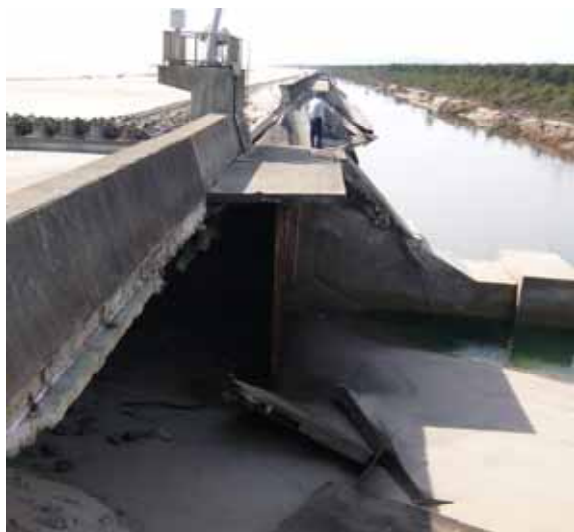
被災後(平成23年3月24日)