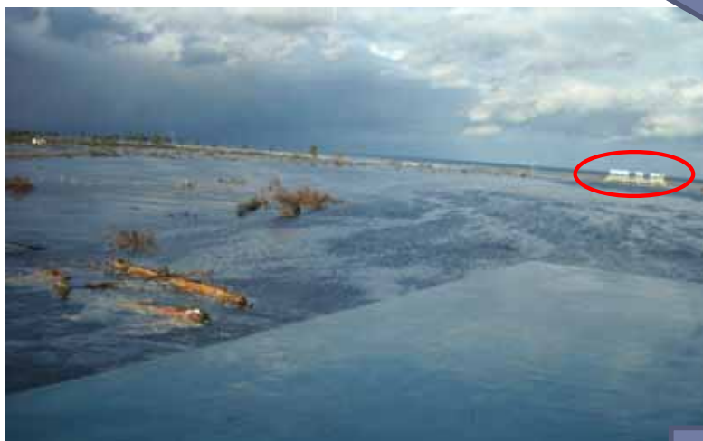
津波到達時(平成23年3月11日17時頃)