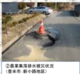
②農業集落排水被災状況 (登米市: 新小路地区)