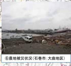
⑥農地被災状況 (石巻市: 大曲地区)