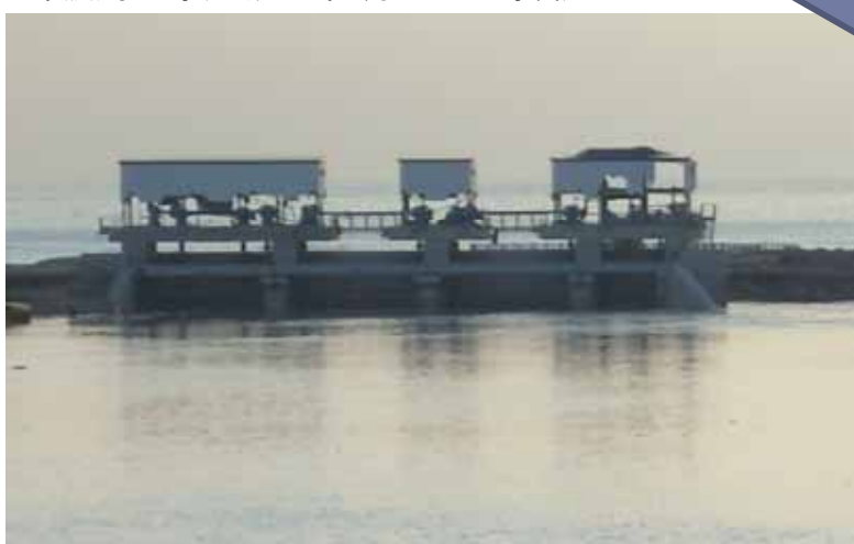
防潮樋門浸水状況(平成23年3月12日7時頃)