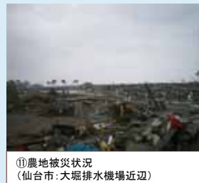
⑪農地被災状況 (仙台市: 大堀排水機場近辺)