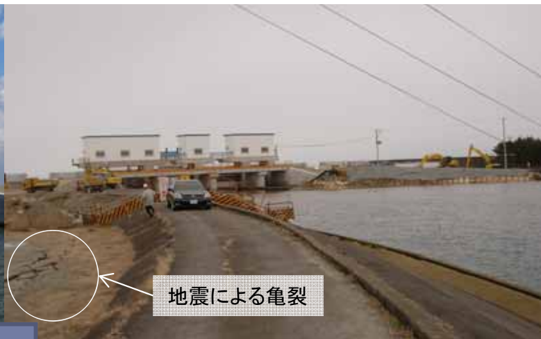
地震直後(津波到達前)(平成23年3月11日15時頃)