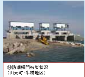
⑭防潮樋門被災状況 (山元町: 牛橋地区)