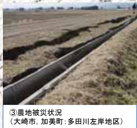
③農地被災状況 (大崎市, 加美町: 多田川左岸地区)