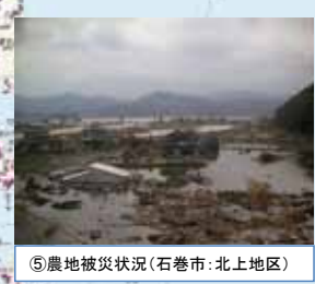
⑤農地被災状況 (石巻市: 北上地区)