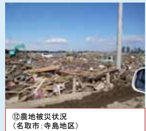
⑫農地被災状況 (名取市: 寺島地区)