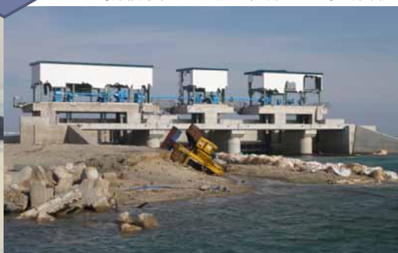
被災後の状況(平成23年4月1日15時20分頃)