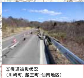
⑨農道被災状況 (川崎町, 蔵王町: 仙南地区)