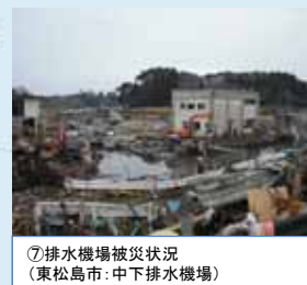
⑦排水機場被災状況 (東松島市: 中下排水機場)