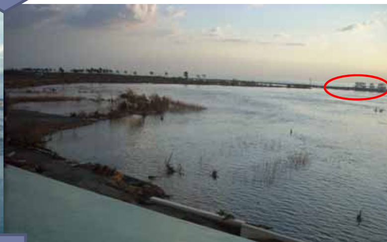
海岸浸水状況(平成23年3月12日6時50分頃)