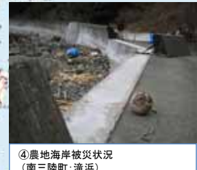
④農地海岸被災状況 (南三陸町: 滝浜)