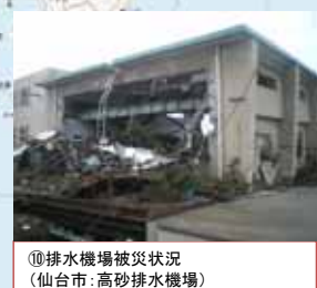
⑩排水機場被災状況 (仙台市: 高砂排水機場)