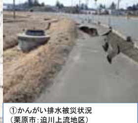
①かんがい排水被災状況 (栗原市: 追川上流地区)