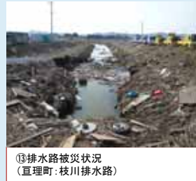
⑬排水路被災状況 (亶理町: 枝川排水路)