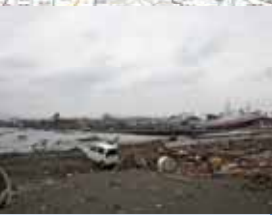
⑥農地被災状況 (石巻市: 大曲地区)