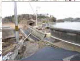
⑧海岸堤防被災状況 (松島町: 駒形・新田海岸堤防)