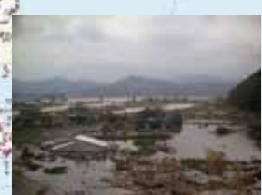
⑤農地被災状況 (石巻市: 北上地区)