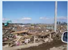
⑫農地被災状況 (名取市: 寺島地区)