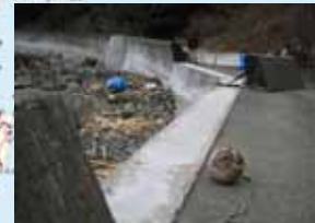
④農地海岸被災状況 (南三陸町: 滝浜)