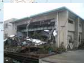
⑩排水機場被災状況 (仙台市: 高砂排水機場)