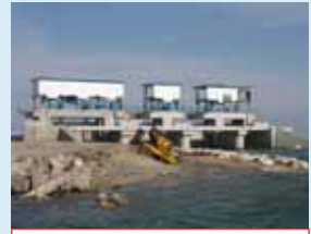
⑭防潮樋門被災状況 (山元町: 牛橋地区)