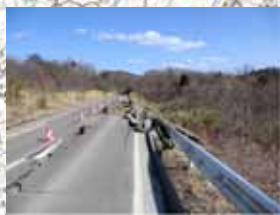
⑨農道被災状況 (川崎町, 蔵王町: 仙南地区)