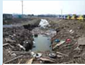
⑬排水路被災状況 (亶理町: 枝川排水路)