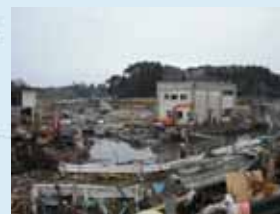
⑦排水機場被災状況 (東松島市: 中下排水機場)