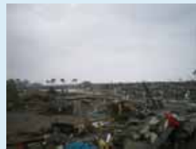
⑪農地被災状況 (仙台市: 大堀排水機場近辺)