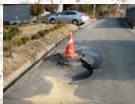
②農業集落排水被災状況 (登米市: 新小路地区)