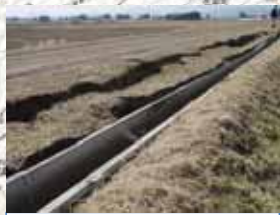
③農地被災状況 (大崎市, 加美町: 多田川左岸地区)