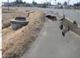
①かんがい排水被災状況 (栗原市: 迫川上流地区)