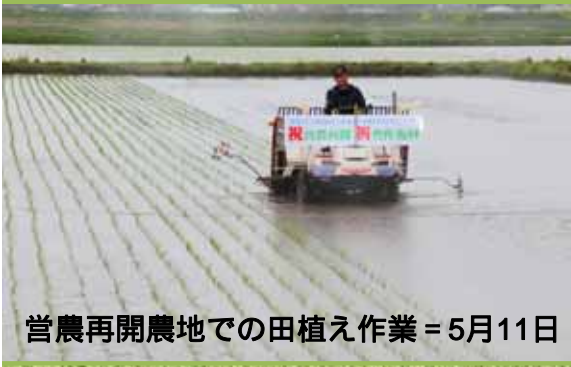
営農再開農地での田植え作業 = 5月11日