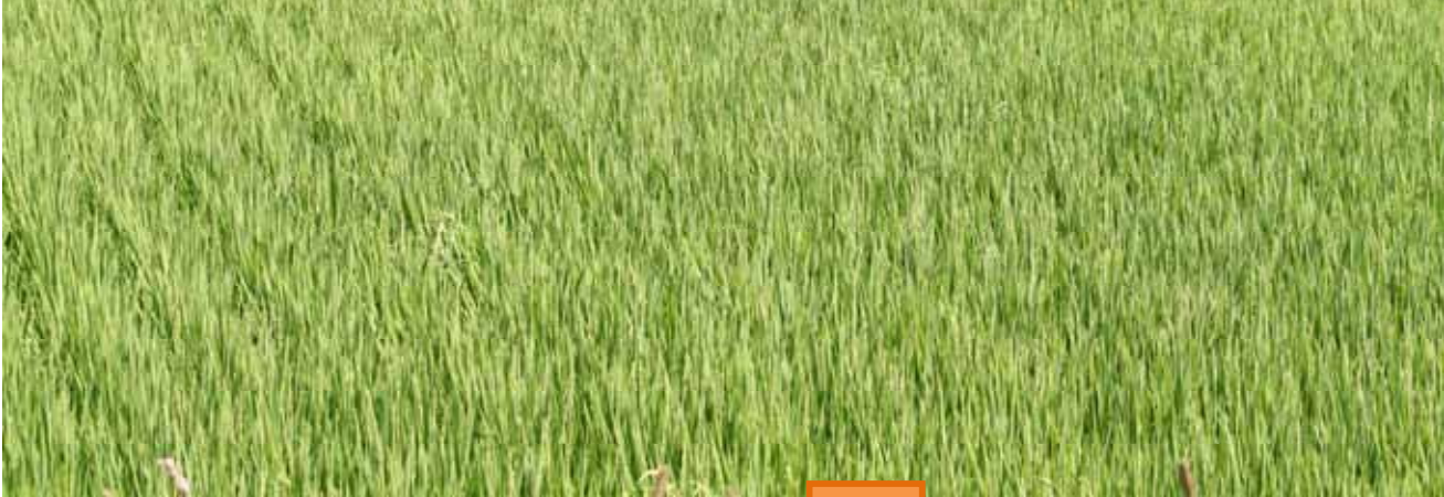
営農再開農地での水稻生育状況 = 8月10日