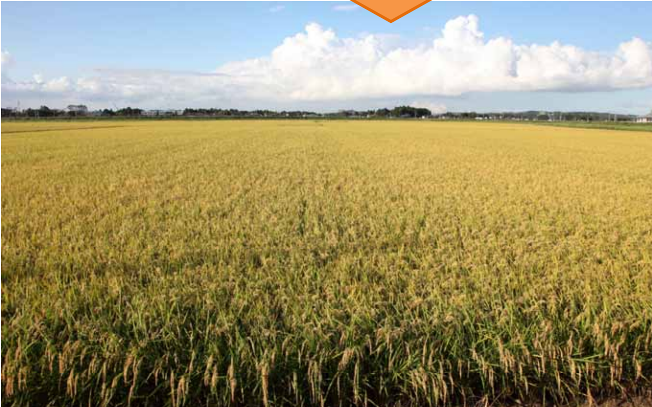
営農再開農地での収穫直前の状況 = 9月22日

5月11日(金)に宮城県東松島市大曲地区で開催された平成24年度作付地域の営農再開「復興・豊作祈願祭」が行われた際に作付けを行った水田にて、平成24年9月22日(土)に無事収穫作業が行われました。 また、関係土地改良区のご協力を得て、本水田で収穫された「復興米」を使用して、平成24年10月23日(火)に農林水産省「消費者の部屋」において、試食提供を行いました。