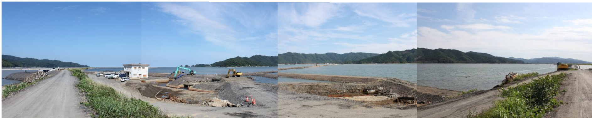
平成24年7月20日(排水開始前)