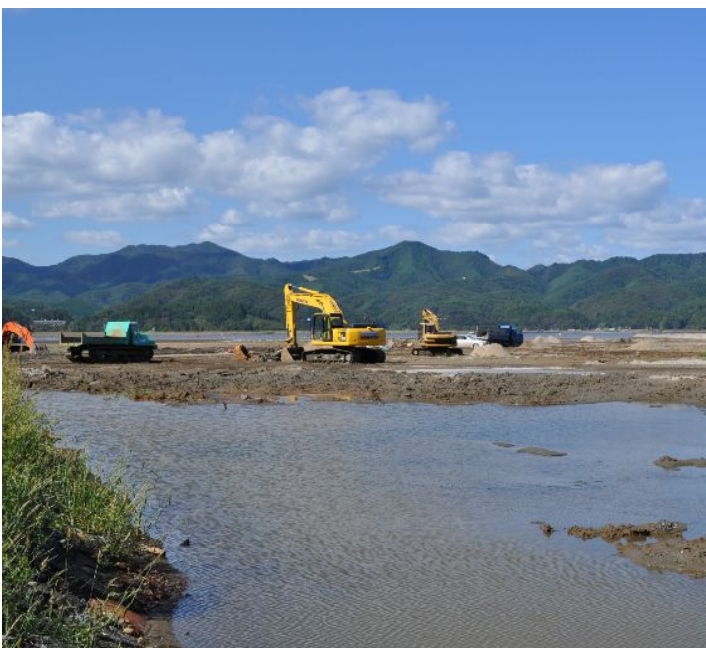
乾陸化が始まり重機が入った様子(平成24年9月26日)