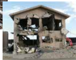
津波による排水機場の被災(山元町)