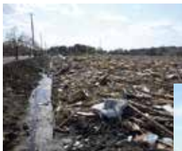
農地の浸水(七ヶ浜町)