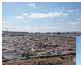
農地の浸水(仙台市)