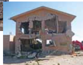
津波による排水機場の被災(山元町)