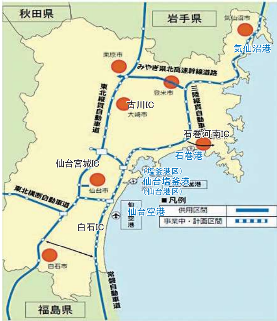
図1 宮城県内の高規格幹線道路・地域高規格道路指定路線図

県中央には東北自動車道が走り、東北唯一の特定重要港湾である仙台塩釜港、国内外に定期便が運航されている仙台空港などのアクセス網が完備されています（図1）。また、東北新幹線で仙台－東京間が最短1時間30分で日帰りビジネスにも快適な環境にあります。