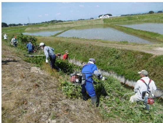
農地維持のための活動