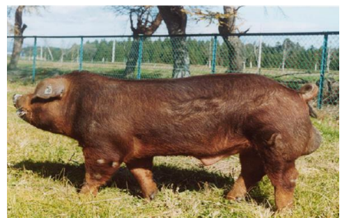
(写真：しもふりレッド)

精液の譲渡後、畜産試験場から1か月分の譲渡料金の通知がありますので支払いを行ってください。