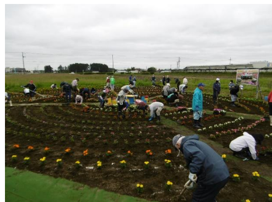
資源向上のための活動