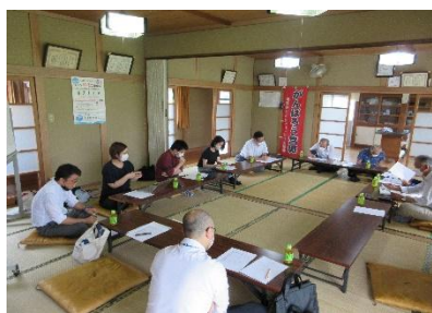
地域住民と大学生による 話し合いの様子(栗原市)