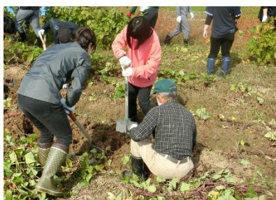
地域住民と大学生による 収穫作業(栗原市)