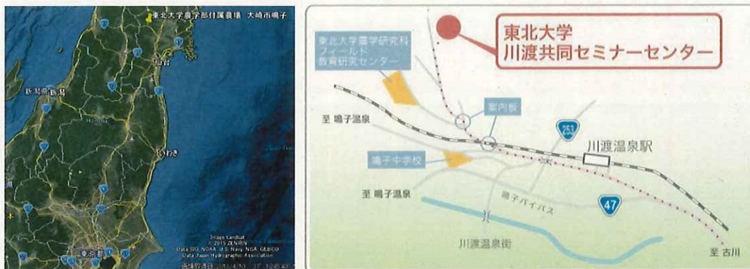
図1, 東北大学大学院農学研究科附属複合生態フィールド教育研究センター施設所在地 (左、縮小; 右、拡大)

東北大学大学院農学研究科附属複合生態フィールド教育研究センター隔離ほ場(通称, 隔離ほ場)および隔離ほ場内施設 (北緯38°44', 東経140°45', 標高170 m)