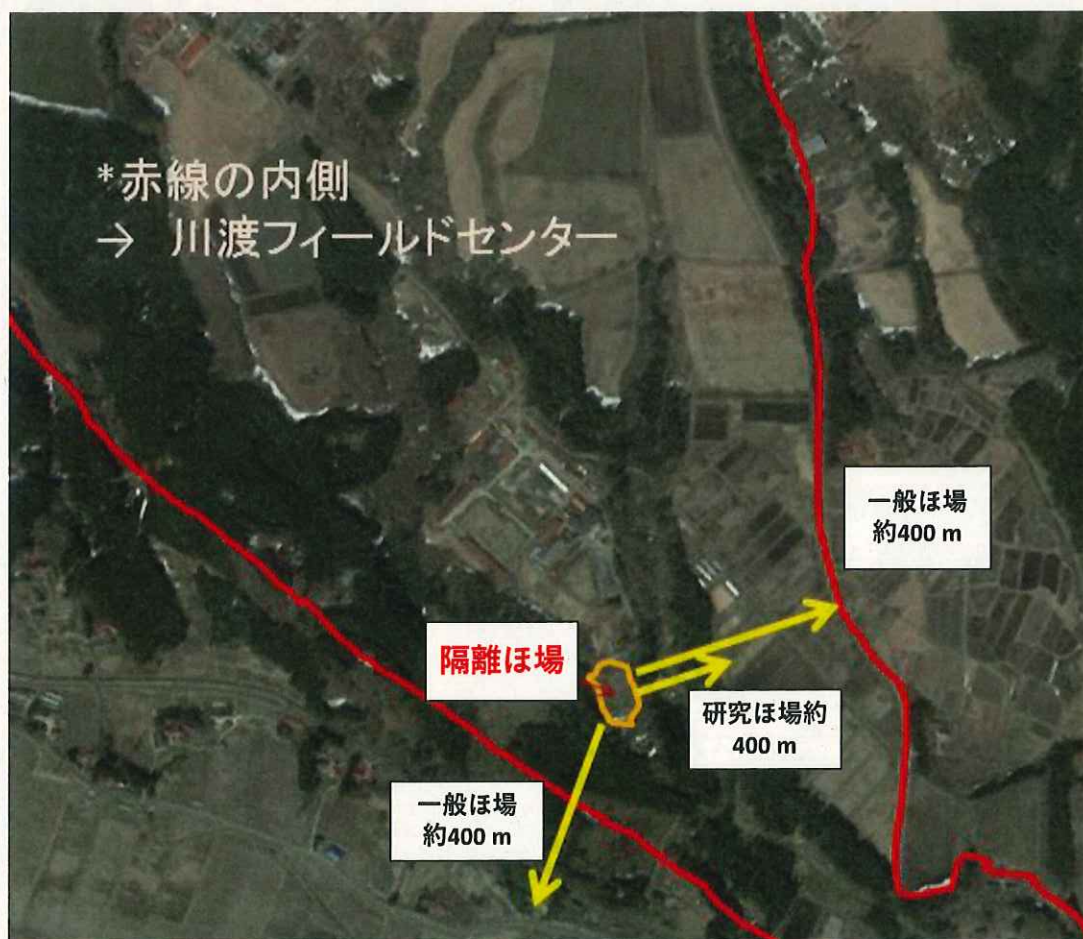
図2, 東北大学大学院農学研究科附属複合生態フィールド教育研究センター周辺隔離ほ場試験区より、最も近い一般農家の水田までの距離は約400 m、また、センター内の最も近い研究用水田までの距離は200 mである。