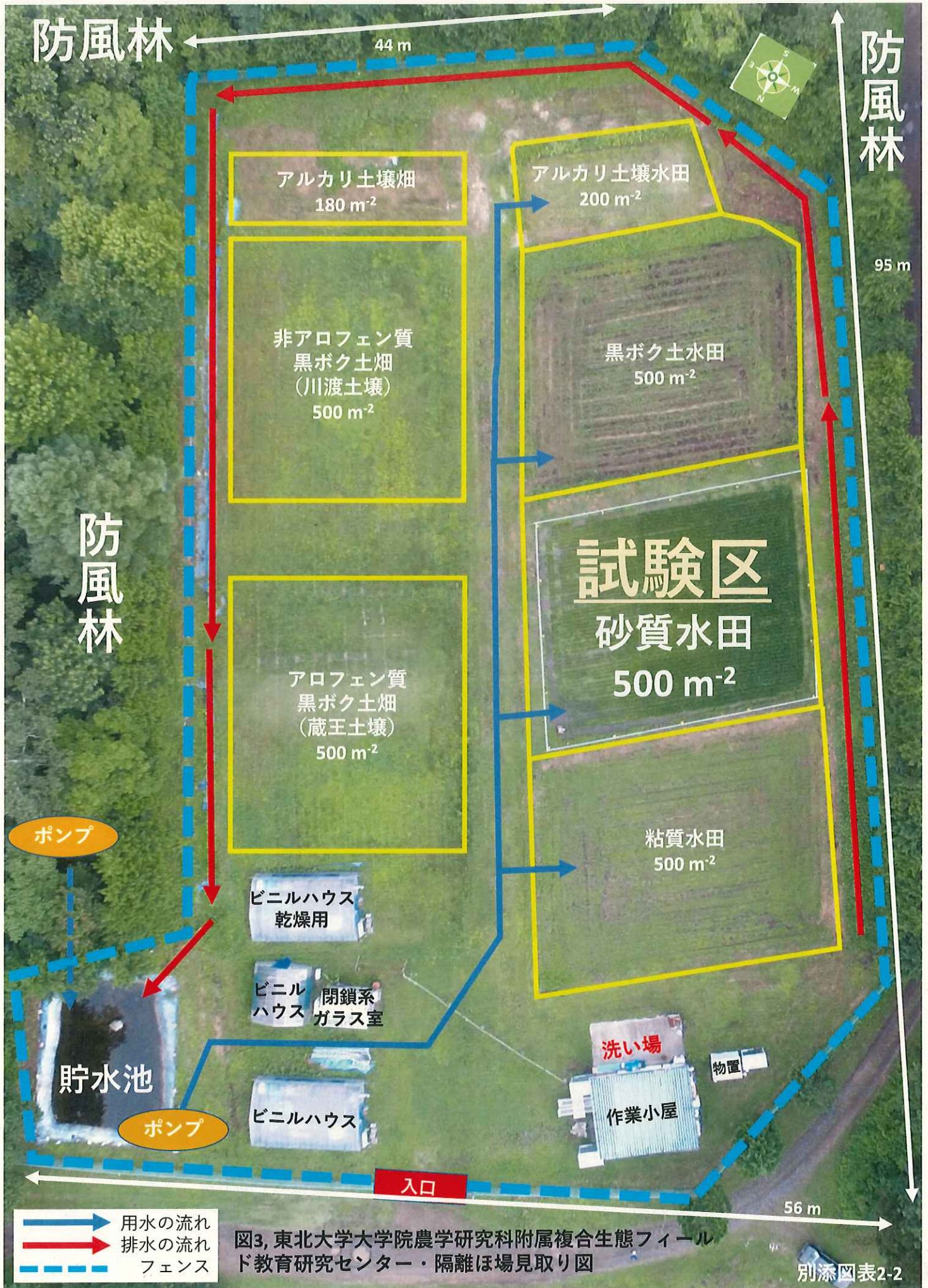
図3, 東北大学大学院農学研究科附属複合生態フィールド教育研究センター・隔離ほ場見取り図