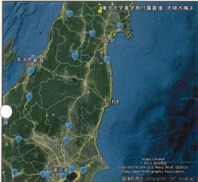
図1 東北大学大学院農学研究科附属複合生態フィールド教育研究センター施設所在地 (1)