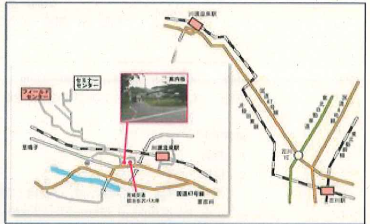
図2 東北大学大学院農学研究科附属複合生態フィールド教育研究センター施設所在地 (2)

http://www.agri.tohoku.ac.jp/noujou/access.html