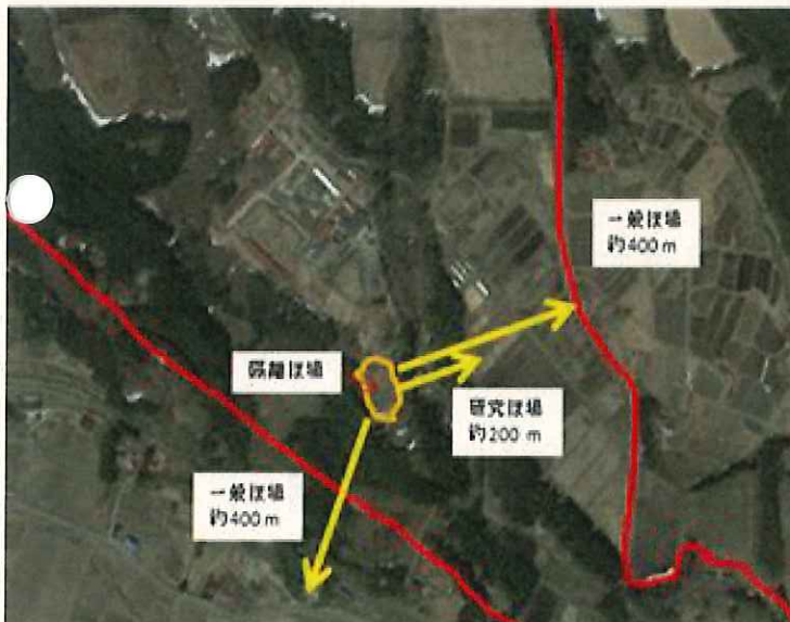
図3 東北大学大学院農学研究科附属複合生態フィールド教育研究センター周辺

隔離ほ場の試験区から、最も近い一般農家ほ場(イネ栽培水田)までの距離は約 400 m、また、最も近いセンター内の研究ほ場は約 200 m である。