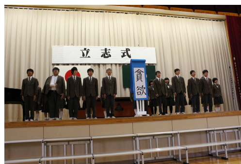
立志式・決意発表の様子