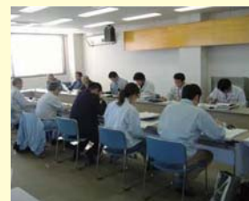
活性化推進会議 下野目東部地区

ほ場整備事業の実施にあたって作成した促進計画の目標達成に向け、各地域の活動を支援する。