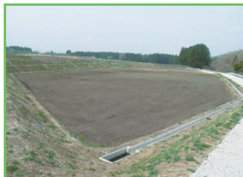
中山間地域総合整備事業 南鹿原地区

農業の生産条件等が不利な中山間地域において、農業生産基盤の整備と併せて、農村生活環境基盤等の整備を総合的に実施することによって、中山間地域における農業農村の活性化を図るとともに国土・環境の保全等を図ります。