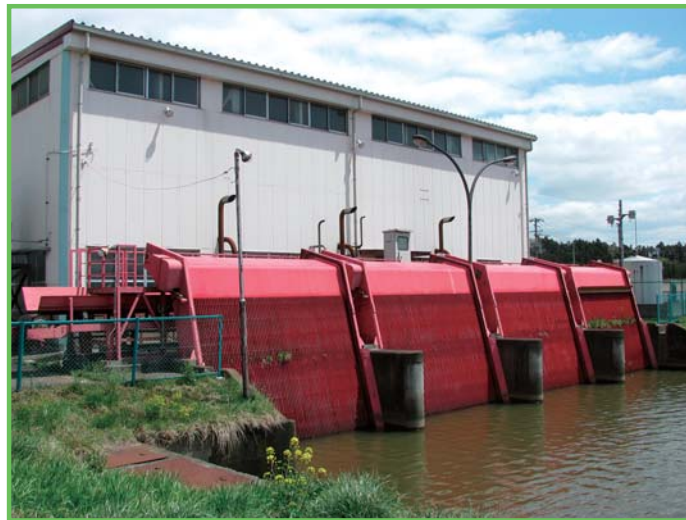
水利施設整備事業(基幹水利施設保全型) 田尻排水機場

ダム・頭首工・用排水機場・幹線用排水路等、基幹的な農業用排水施設の整備を行い、用水不足の解消や水害防止をはじめとした水利利用の安定と合理化により、農業生産性の安定を図るものです。