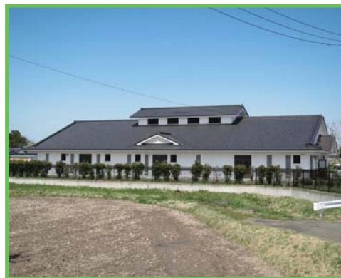
農業集落排水事業 西古川地区

都市に比べて立ち遅れている農村の生活環境の整備と、これと密接な関連のある農業生産基盤の整備を一体的・総合的に行うもので、農業集落排水施設の整備をはじめ、集落道路・集落排水路・農村公園・営農飲雑用水施設・農道・農業排水路等を整備します。