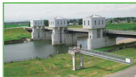
基幹水利施設管理事業 桑折江頭首工

国営土地改良事業で造成された基幹的な農業水利施設について適正な維持管理を行います。