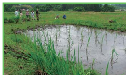
中山間地域等直接支払 交付金事業 大尺集落

中山間地域等における多面的機能の維持・増進を図るため、自律的かつ継続的な農業生産活動等の体制整備に向けた前向きな取り組みを支援します。