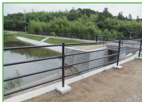
県営ため池等整備事業 砂子沢地区

自然的社会的状況の変化で脆弱化している農業用施設で、豪雨・地震等で被災した場合、周囲の農地・施設・人家等に被害を与えるおそれがあるものについて、被害を未然に防止するため、施設の整備・補強を行います。