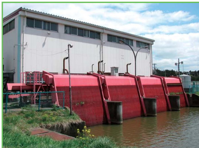
水利施設整備事業（基幹水利施設保全型） 田尻排水機場

ダム・頭首工・用排水機場・幹線用排水路等、基幹的な農業用排水施設の整備を行い、用水不足の解消や水害防止をはじめとした水利用の安定と合理化により、農業生産性の安定を図るものです。