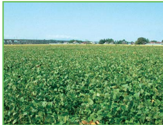
経営体育成基盤整備事業 敷玉西部地区

水田の区画整理工事を中心に用排水路・道路・暗渠排水・客土等総合的な整備を行い、大型機械の導入による労働生産性の向上を図るとともに農地の汎用化を推進します。