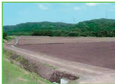
中山間地域総合整備事業 南鹿原地区

農業の生産条件等が不利な中山間地域において、農業生産基盤の整備と併せて、農村生活環境基盤等の整備を総合的に実施することによって、中山間地域における農業農村の活性化を図るとともに国土・環境の保全等を図ります。