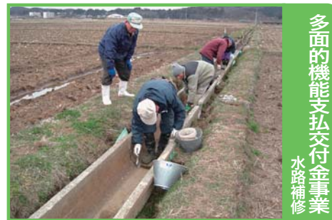
多面的機能支払交付金事業 水路補修

農業の多面的機能の維持・発揮のため、地域ぐるみで効果の高い共同活動を一体的かつ総合的に支援します。