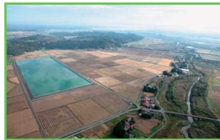
農村災害対策整備事業 沖富地区

甚大な災害を受けた地域において、再度の災害発生を防止するための農業用施設等の整備に併せて、持続的な営農が行われ農業用施設等の洪水防止等の防災機能を十分発揮させるために、農業生産基盤の整備と農村生活維持施設の整備を行います。