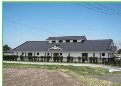
農業集落排水事業 西古川地区

都市に比べて立ち遅れている農村の生活環境の整備と、これと密接な関連のある農業生産基盤の整備を一体的・総合的に行うもので、農業集落排水施設の整備をはじめ、集落道路・集落排水路・農村公園・営農飲雑用水施設・農道・農業排水路等を整備します。