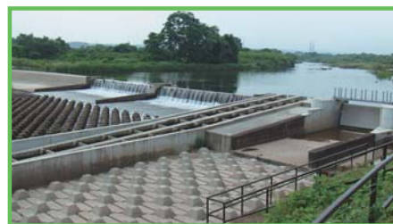
基幹水利施設管理事業 三丁目頭首工

国営土地改良事業で造成された基幹的な農業水利施設について適正な維持管理を行います。