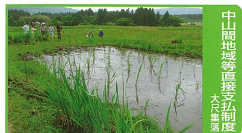
中山間地域等直接支払制度 大尺集落

中山間地域等における多面的機能の維持・増進を図るため、自律的かつ継続的な農業生産活動等の体制整備に向けた前向きな取り組みを支援します。