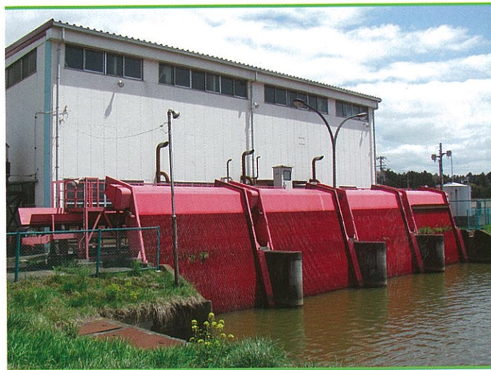
基幹水利施設ストックマネジメント事業 田尻排水機場

ダム・頭首工・用排水機場・幹線用排水路等、基幹的な農業用排水施設の整備を行い、用水不足の解消や水害防止をはじめとした水利用の安定と合理化により、農業生産性の安定を図るものです。