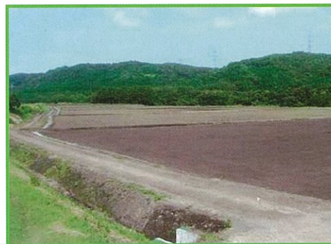
中山間地域総合整備事業 — 南鹿原地区

農業の生産条件等が不利な中山間地域において、農業生産基盤の整備と併せて、農村生活環境基盤等の整備を総合的に実施することによって、中山間地域における農業農村の活性化を図るとともに国土・環境の保全等を図ります。