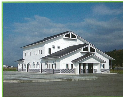
農業集落排水事業 — 粟地区

都市に比べて立ち遅れている農村の生活環境の整備と、これと密接な関連のある農業生産基盤の整備を一体的・総合的に行うもので、農業集落排水施設の整備をはじめ、集落道路・集落排水路・農村公園・営農飲雑用水施設・農道・農業排水路等を整備します。