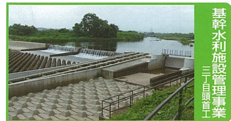
基幹水利施設管理事業 三丁目頭首工

国営土地改良事業で造成された基幹的な農業水利施設について適正な維持管理を行います。