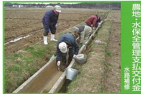
農地水保全管理支払交付金 水路補修

地域において農地・水の良好な保全管理と水路・農道等の補修・更新などの活動により長寿命化対策を強化するため、地域ぐるみで効果の高い共同活動等を一体的かつ総合的に支援します。