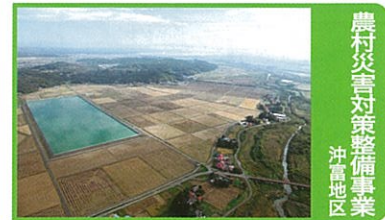
農村災害対策整備事業 沖富地区

甚大な災害を受けた地域において、再度の災害発生を防止するための農業用施設等の整備に併せて、持続的な営農が行われ農業用施設等の洪水防止等の防災機能を十分発揮させるために、農業生産基盤の整備と農村生活維持施設の整備を行います。