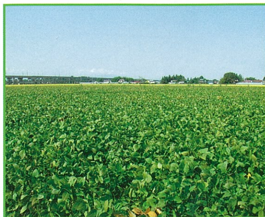
経営体育成基盤整備事業 敷玉西部地区

水田の区画整理工事を中心に用排水路・道路・暗渠排水・客土等総合的な整備を行い、大型機械の導入による労働生産性の向上を図るとともに農地の汎用化を推進します。