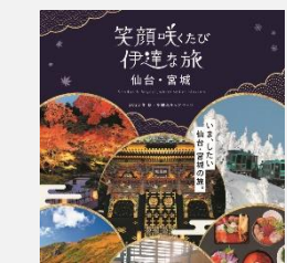
2023年秋・冬観光キャンペーンガイドブック