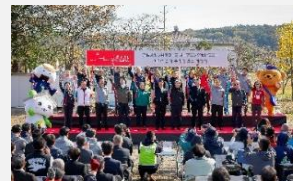
オープニングイベント