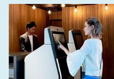
省人化機器の導入