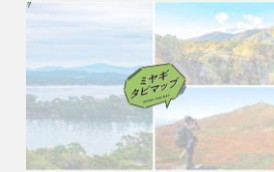
観光用デジタルマップ

観光地内での周遊を促進するために、観光施設や周辺駐車場の混雑状況を計測し、観光用デジタルマップで情報発信