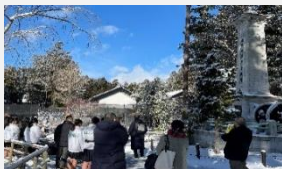
教育旅行誘致促進（モニターツアー）