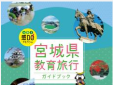
宮城県教育旅行ガイドブック