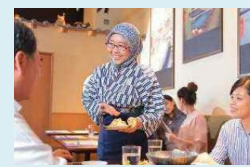
外国人労働者の雇用