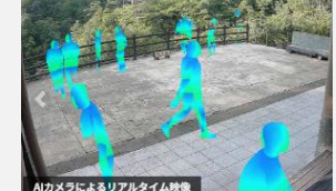
混雑状況可視化の様子