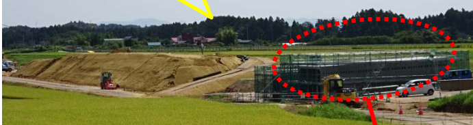
写真② 函渠の設置状況

写真①(国道4号築館バイパスから(1)区間を望む) 盛土工・函渠工を行っています。