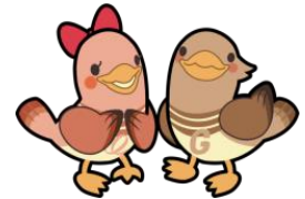
宮城県がん征圧イメージキャラクター グー子 & がん助