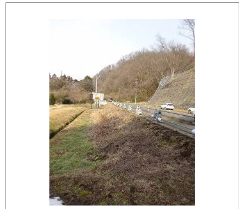
駐車スペース設置予定