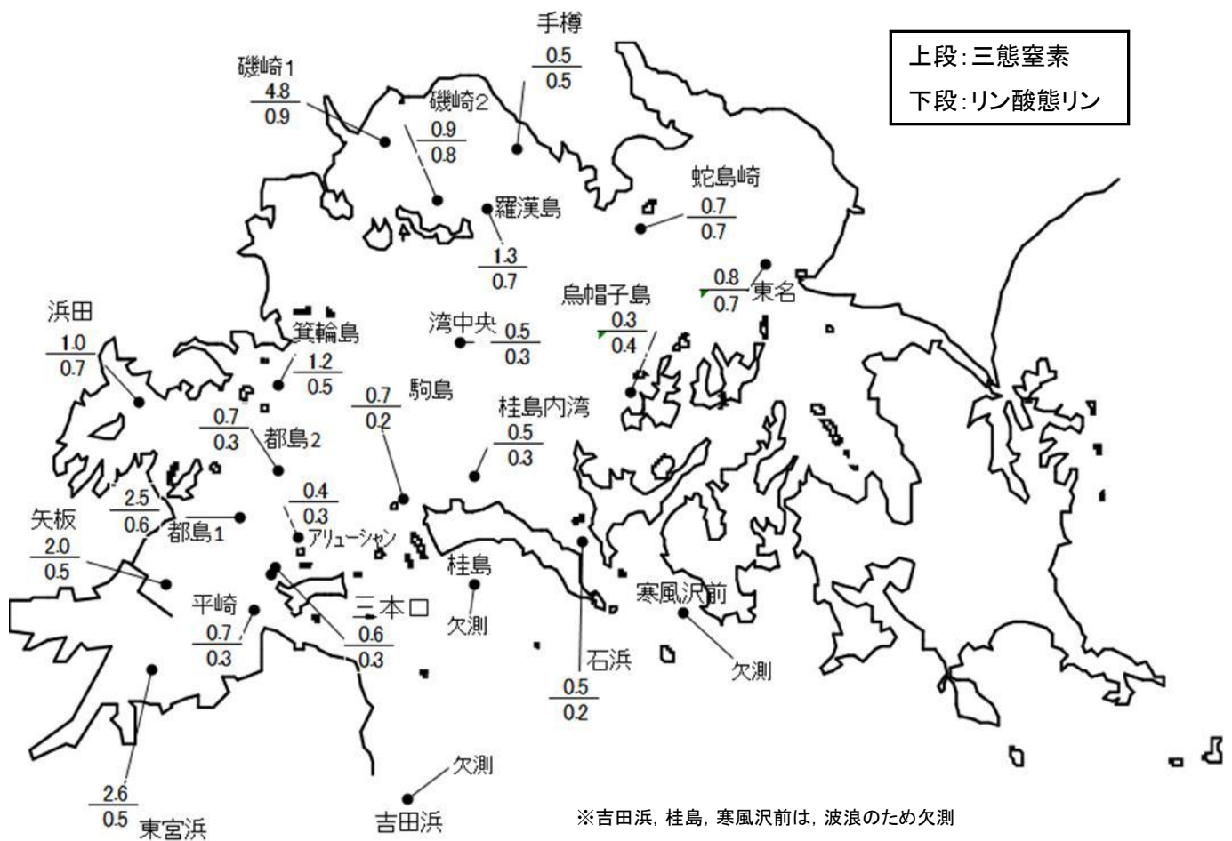
図1 松島湾の栄養塩

○ リン酸態リンは、松島湾内が 0.2 \sim 0.9 \mu\text{g-at}/\ell 、松島湾外(石浜)が 0.2 \mu\text{g-at}/\ell です。